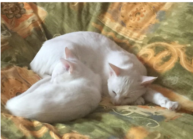
Rechts onder: "brombeer" Pukkie