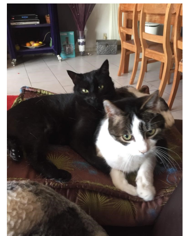
Links onder: klei- ne Spook met mams Moeska